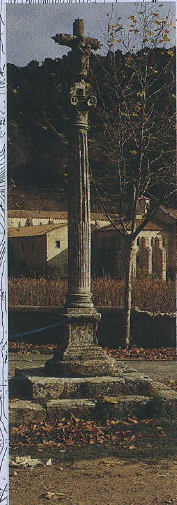
MONASTERIO DE IRANZU